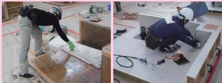
～建築物の漏水を防ぐ～

建設業は、現在 28 職種 of 専門業種に分かれております。その中には、建築一式を行う事業所のほかに、左官、型枠、鉄筋、建築塗装、防水、屋根、建具、とび、板金など専門的な業種の施工により建築物が建てております。